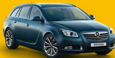
INSIGNIA SPORTS TOURER

Corsa zwycięża w klasyfikacji generalnej.