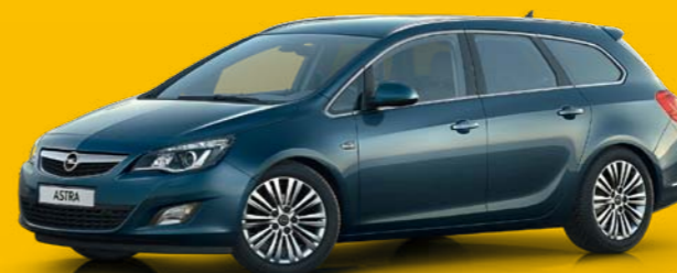
ASTRA SPORTS TOURER

Insignia zwycięża w klasyfikacji generalnej.