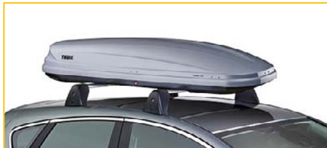
Pojemnik dachowy Thule Pacific 700