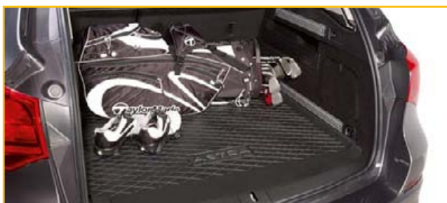
Mata podłogi bagażnika