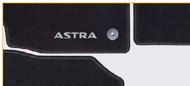
Welurowe dywaniki podłogowe