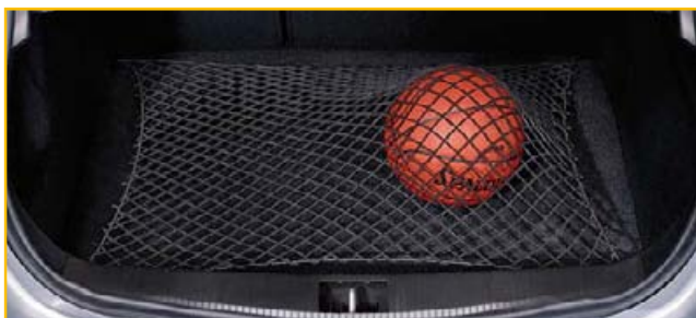
Siatka bagażowa na podłogę