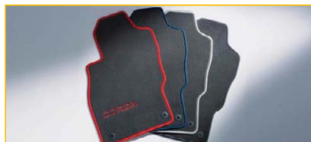
Welurowe dywaniki podłogowe