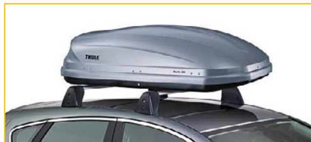
Pojemnik dachowy Thule Pacific 200