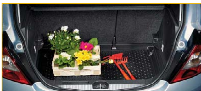
Mata podłogi bagażnika