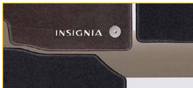
Welurowe dywaniki podłogowe