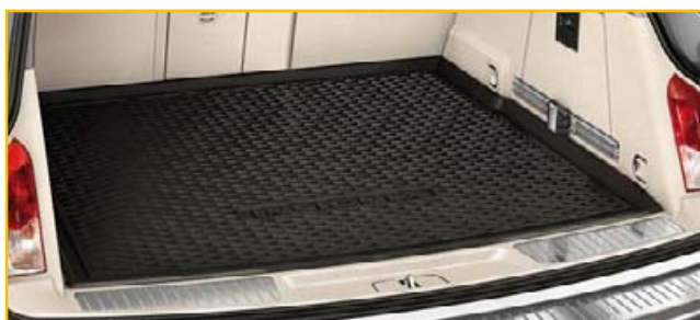
Mata podłogi bagażnika