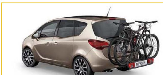
Uchwyt rowerowy na hak