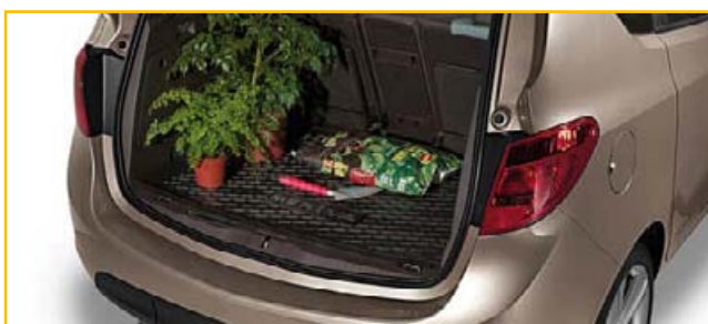
Mata podłogi bagażnika