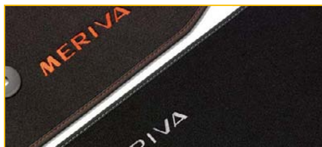
Welurowe dywaniki podłogowe