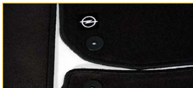
Welurowe dywaniki podłogowe