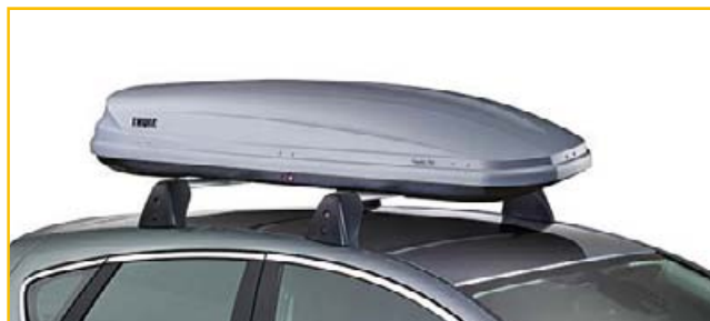
Pojemnik dachowy Thule Pacific 700