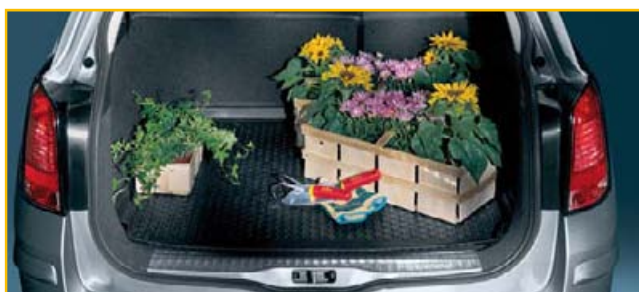
Mata podłogi bagażnika