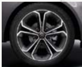
Obręcze kół ze stopów lekkich 17 x 7", 5-ramiennie podwójne, tytanowe wykończenie, opony 215/45 R 17 (PNM).