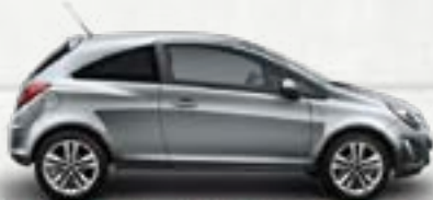
Srebrny Silver Lake