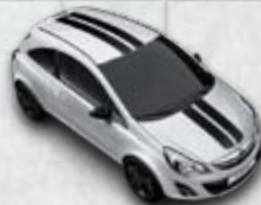
Srebrny Sovereign/czarne dodatki