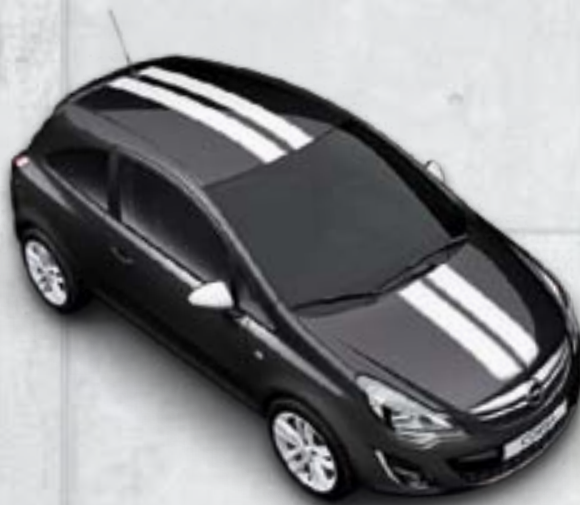
Czarny Carbon Flash/białe dodatki