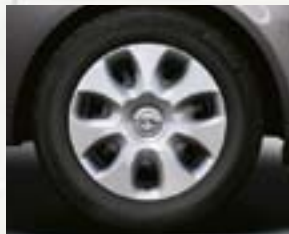
Stalowe obręcze kół z kołpakami 15 x 6", 7-ramiennie, opony 185/65 R 15 (QV7).