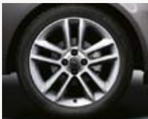
Obręcze kół ze stopów lekkich 17 x 7", 5-ramiennie podwójne, opony 215/45 R 17 (QV3).