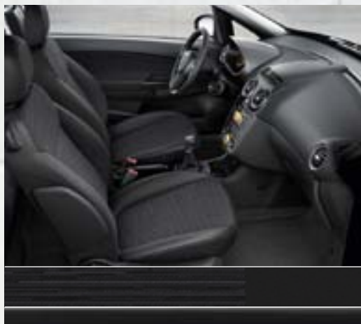
Graphite: Wega/Morrocana 1 , Charcoal Konsola centralna: czarna Japan Black