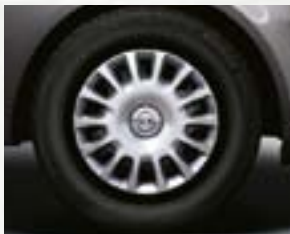
Stalowe obręcze kół z kołpakami 14 x 5,5", 14-ramiennie, opony 185/70 R 14 (PA8).