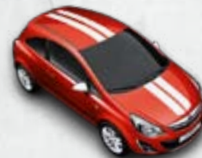
Czerwony Magma/białe dodatki