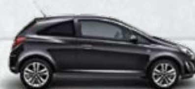
Czarny Carbon Flash