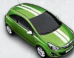
Zielony Grasshopper/białe dodatki