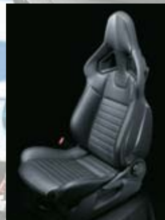
Tapicerka skórzana Nappa 2 , Charcoal