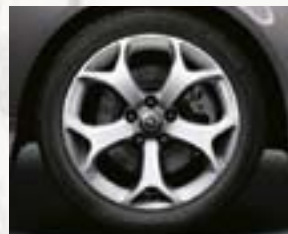
Obręcze kół ze stopów lekkich 17 x 7", 5-ramiennie Y OPC, opony 215/45 R 17 (PNJ).