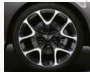
Obręcze kół ze stopów lekkich 18 x 7,5", 5-ramiennie w układzie V, opony 225/35 R 18 (PXJ).