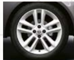
Obręcze kół ze stopów lekkich 17 x 7", 5-ramiennie podwójne, białe, opony 215/45 R 17 (QV3, 40P).