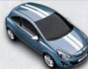
Niebieski Crinan/białe dodatki