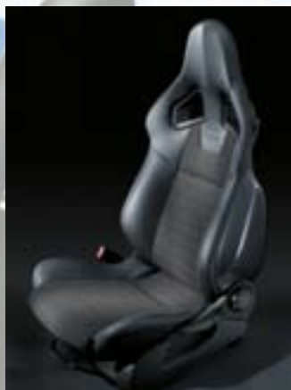
Tapicerka Splice Silver/Morrocana 1 , Charcoal