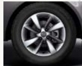
Obręcze kół ze stopów lekkich 15 x 6", srebrne, wzór Rotation opony 185/65 R 15 (RRK).