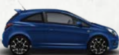
Niebieski Arden 1