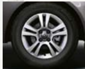
Obręcze kół ze stopów lekkich 15 x 6", 5-ramiennie podwójne, opony 185/65 R 15 (QV5).