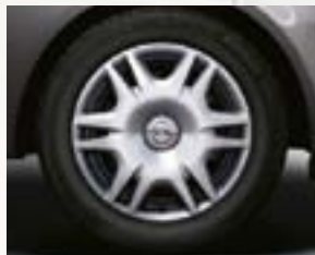
Stalowe obręcze kół z kołpakami 16 x 6", 6-ramiennie, opony 195/55 R 16 (P2V).