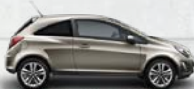
Beżowy Pepper Dust