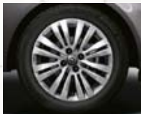
Obręcze kół ze stopów lekkich 16 x 6", 8-ramiennie podwójne, opony 195/55 R 16 (PXU).