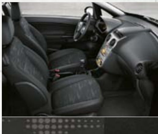
Active: Reflexion, Charcoal Konsola centralna: srebrna Matt Chrome