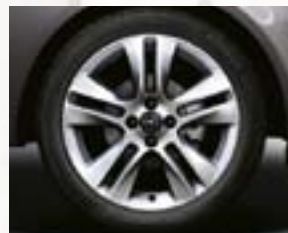
Obręcze kół ze stopów lekkich 17 x 7", 5-ramiennie podwójne, opony 215/45 R 17 (RZS).