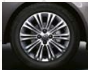
Obręcze kół ze stopów lekkich 16 x 6", 10-ramiennie podwójne, opony 195/55 R 16 (NWK).