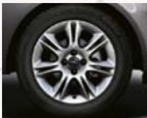
Obręcze kół ze stopów lekkich 16 x 6", 7-ramiennie podwójne, opony 195/55 R 16 (QV4).