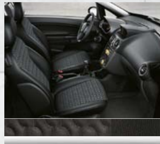
Cosmo: Drops/Morrocana 1 , Charcoal Konsola centralna: czarna Japan Black