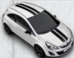
Biały Casablanca/czarne dodatki

Pakiet Linea. Przyciągające wzrok pasy na karoserii, boczne lusterka i obręcze kół ze stopów lekkich dostępne w zestawieniach kolorystycznych zaprezentowanych na grafikach.