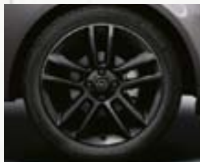
Obręcze kół ze stopów lekkich 17 x 7", 5-ramiennie podwójne, czarne, opony 215/45 R 17 (QV3, 80P).