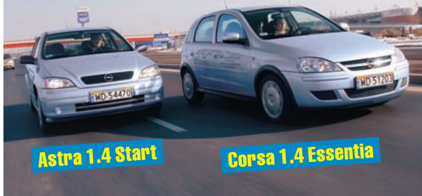
Astra 1.4 Start