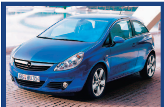
Prosta i jednocześnie zgrabna wersja 3-drzwiowa może pełnić rolę małego, sportowego coupé

rowana będzie w 5 wersjach wyposażeniowych: Essentia (bazowa), Enjoy (lifestylowa), Sport (z chromowanymi dodatkami i sztywniejszym zawieszeniem), Cosmo (luksusowa) i agresywnej OPC. Już w podstawowej standardem mają być ABS, ESP, cztery poduszki powietrzne, elektryczne wspomaganie układu kierowniczego i tarczowe hamulce na wszystkich kołach. Na liście opcji znajdują się m.in.: skórzana tapicer-