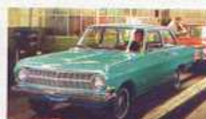
1963 Rekord A inspirowany był szkołą stylistyczną Chevroleta