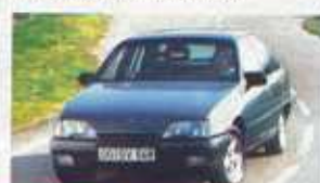
1986 Koniec ery Rekorda. Zastąpił go Opel Omega A