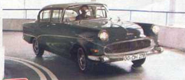
1957 Dwie panoramiczne szyby i grill w stylu amerykańskiego Buicka – model P1 symbolizował dynamiczny rozwój Europy Zachodniej

Atrakcyjny design, przestronne wnętrze i solidna technika – dzięki tym cechom Opel był w latach 60. i 70. XX w. ulubioną marką klasy średniej