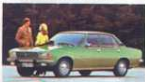
1972 Rekorda D wyróżniał włoski styl nadwozia