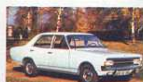
1966 Sprzedaż Rekorda C przekroczyła milion sztuk