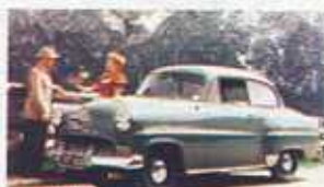
1953 Rekord z nowoczesnym, dwudrzwiowym nadwoziem