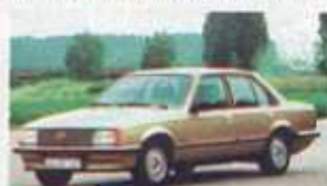
1977 Ostatnią generacją Rekorda był model E